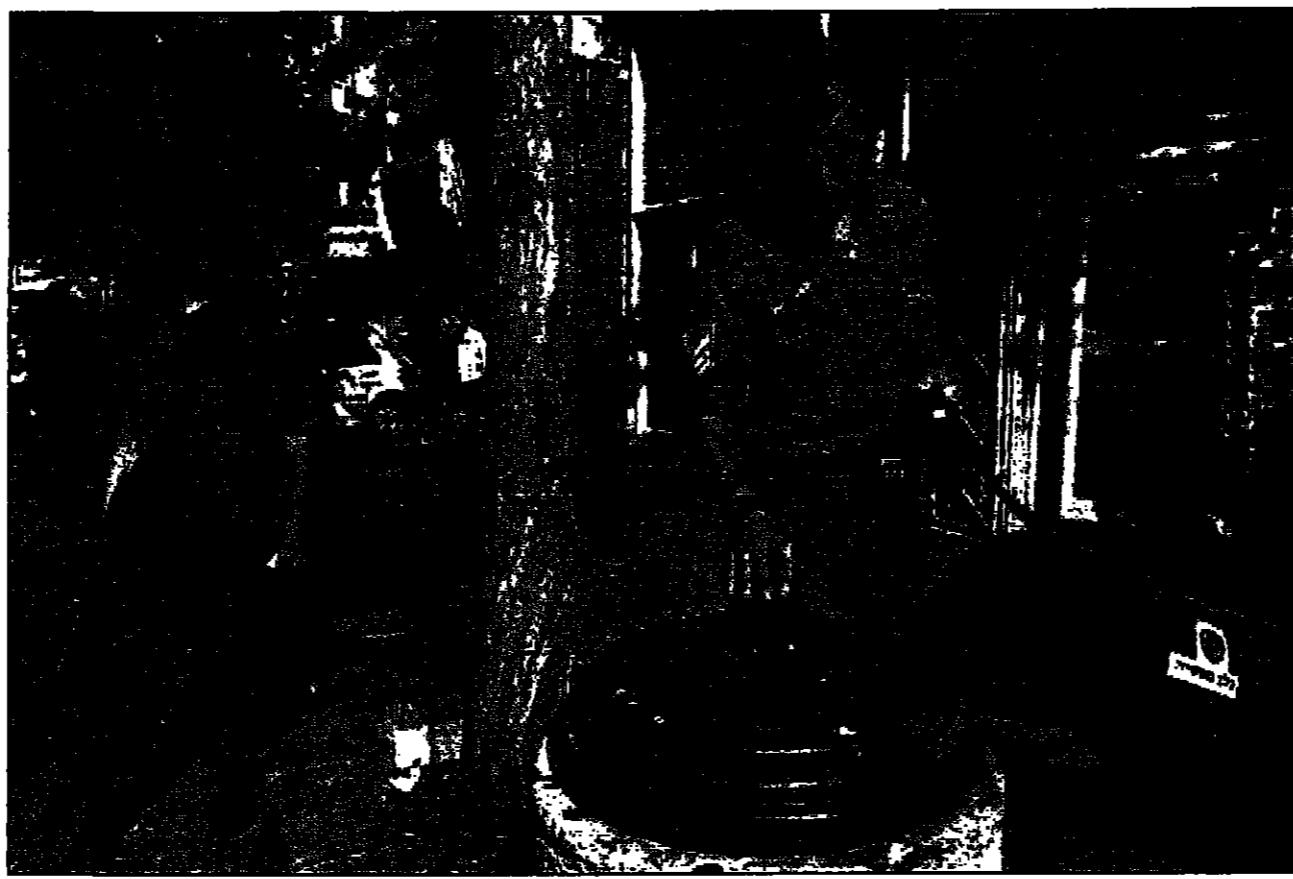
جنديان اسراييليان يجران جثماناً في شوارع القدس ضمن حالة تاهب قسوى لجمع عناصر الجيش الاسرائيلي بعد اختراق سيارة مفخخة اس في القدس الغربية

رام الله - القدس العربي - من عيد الرؤوف ارتباطاً مع احتفالات عيد الفصح، احتك مصادر فلسطينية مطلعة لم تعرض أية مقترحات محددة من شأنها جسر الهوة بين الطرفين الفلسطيني والاسرائيلي في اجتماع عال المستوى عقد مساء امس الاول في تل ابيف، غير ان اللقاءات بين الجانبين ستواصل اليوم الثلاثاء. وقال مصدر فلسطيني مطلع ان اللقاءات بين الجانبين لم تحقق اي اختراق، بل بقيت المفاوضات على مستواها الحالي. وقال مصدر فلسطيني مطلع ان اللقاءات بين الجانبين لم تحقق اي اختراق، بل بقيت المفاوضات على مستواها الحالي.